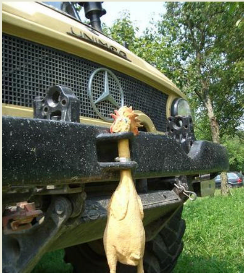
the winner takes it all: